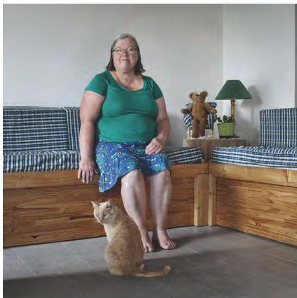
© Tjorven Bruyneel – Mum and Arnold

Pour moi, la photographie est une langue en soi, un moyen de comprendre mon entourage, un sentiment que je ne peux pas exprimer en mots. Je suis bien consciente que la réalité photographique n'est qu'une illusion, car le sens profond peut résider dans ce que j'ai laissé de côté délibérément. Une histoire où le spectateur projette ses propres émotions, ses interprétations et ses influences culturelles, les moyens avec lesquels se posent les questions sur notre société. Mes interprétations visuelles se développent à travers une variété de projets avec un thème commun : l'enquête sur le sens de l'identité.