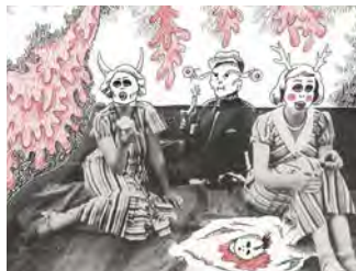
Série Freudian Flip