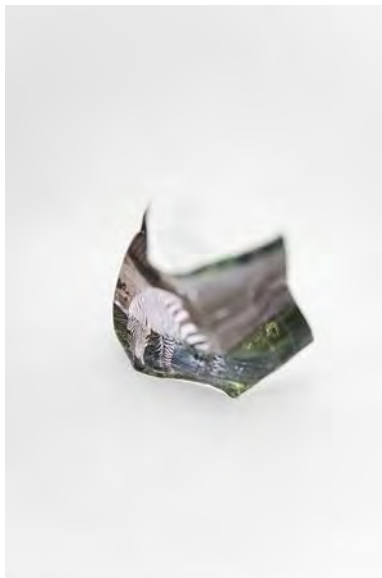
© Mimi Youn – Shape memory VI, 2016

Cependant, elle a senti qu'il y avait des limites pour exprimer ses pensées, ses émotions et ses idées à travers une pratique photographique traditionnelle. Pour son travail, elle utilise un appareil Polaroid. Après avoir pris une photo, elle intervient sur la surface du polaroid. La plupart des photos qu'elle prend semblent ambiguës et vagues en raison de la surexposition intentionnelle. Cependant, les traces coupées dans les photographies semblent paradoxalement fortes et douloureuses. Avant de fixer l'image sur la surface du polaroid, lors du processus de développement, elle modifie souvent la surface en la pliant, en secouant ou grattant avec un couteau, ce qui fait se propager l'émulsion sous la surface. Elle se concentre davantage sur ses actions au cours du développement que sur les résultats finaux de l'image.