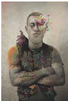
Projet conçu et soutenu par le Service pénitentiaire d'insertion et de probation des Deux-Sèvres (SPIP-79).