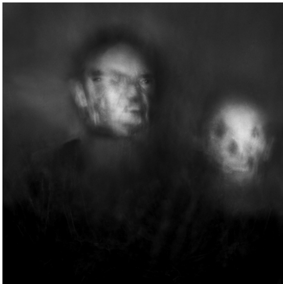
© Tao Douay – Sans titre, 2012

Professeur de philosophie, historien de l'art