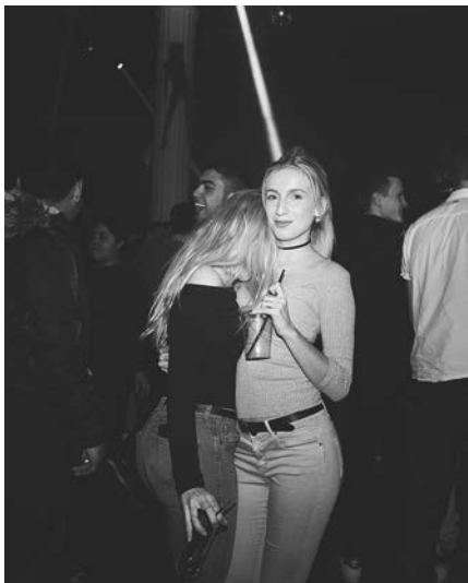
Titre de la série: « Nightclubs » Commande photographique nationale « La jeunesse en France » pilotée par le Centre national des arts plastiques en collaboration avec l'association CÉTÀVOIR FNAC 2017-0037 Collection du Centre national des arts plastiques