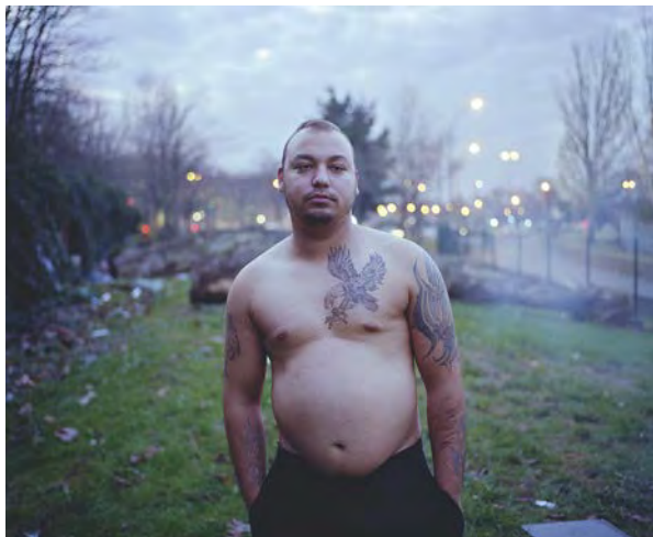
Titre de l'œuvre: ROM (1994) – Porte d'Aubervilliers, Paris 2017 Titre de la série: « CityWalk » Commande photographique nationale « La jeunesse en France » pilotée par le Centre national des arts plastiques en collaboration avec l'association CÉTÀVOIR FNAC 2017-0033 Collection du Centre national des arts plastiques