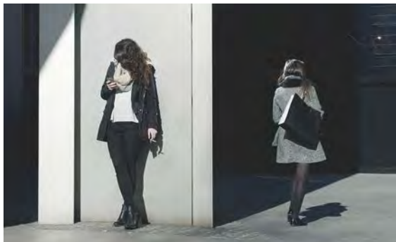
In Company of Strangers, Londres

Un livre sur ce projet sera publié en 2017 par Kehrer Verlag. Il comprendra des photographies des villes de New York, São Paulo, Séoul, Mumbai, Hong Kong, Londres, Lagos, Istanbul et Mexico. Un contexte théorique sera fourni dans trois essais par un sociologue, un urbaniste et un théoricien du film ainsi qu'un entretien avec l'artiste par un historien/conservateur d'art.