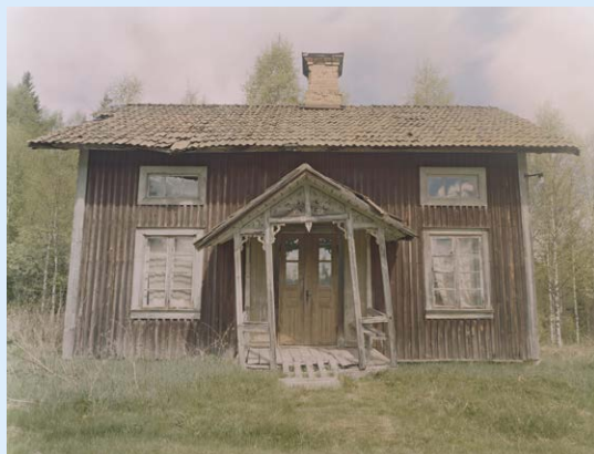
From Back Home , 2009

Mêlant séries photographiques et films, cette exposition offre une déambulation dans l'œuvre de