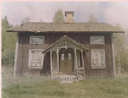
From Back Home , 2009

Combining photographic series and films, this exhibition provides a tour through JH Engström's