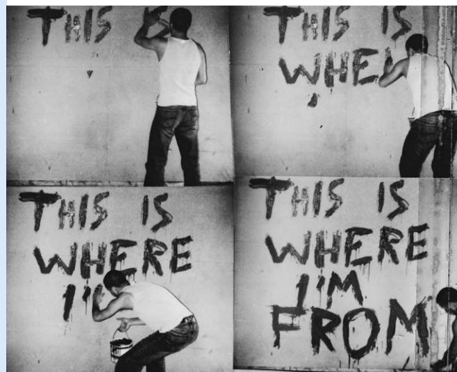
Tout va bien , 2015

différentes publications de l'artiste, les poèmes visuels Try poetry (de la série Haunts , 2006) et Towards Light (2019). JH Engström interroge les significations multiples des lieux de nos existences, à l'instar des photographies de lits (de la série Trying to Dance , 2004) - le lit, théâtre de nos pulsions physiques et matérielles mais aussi véhicule des voyages immatériels de nos rêves. L'artiste interroge également notre rapport au corps, et par là même notre place dans le monde, à travers un ensemble de nus frontaux (de la série Trying to Dance , 2004) et le film inédit Djuret / L'Animal / The Animal (2020). Enfin le parcours se conclut avec l'installation vidéo Ordet / Le Mot / The Word (2017) dans laquelle l'artiste se montre en train d'inscrire sur le mur de son atelier les mots qui abritent les notions fondamentales et abstraites à l'origine de ses réflexions, ce dans les trois langues de sa vie (suédois, français, anglais) : quand le mot devient une image, que les idées sont exposées et que leur sens est équivoque.